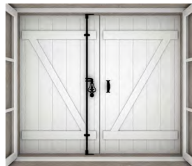
Vue de l'intérieur sans traverses